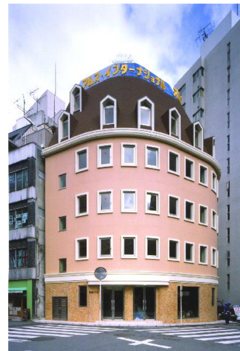
対象不動産 アムス第2ビル