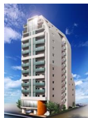
アムス四谷三丁目